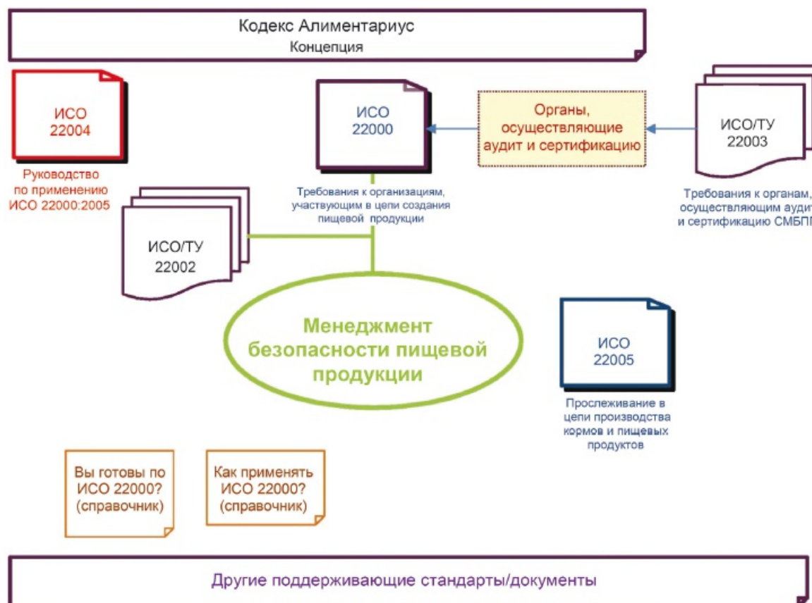
Рисунок 1 - Обзор связанной с ИСО 22000 документации

Справочник [10] по ИСО 22000, также называемый "fitness checker" ("руководство по проверке пригодности"), впервые изданный в 2006 г., ориентирован на малые предприятия, которые не знакомы с ИСО и ее стандартами. Справочник дает этим организациям указания относительно будущей сертификации.